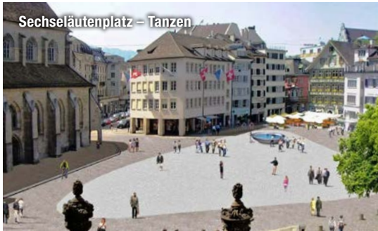
Sechseläutenplatz – Tanzen