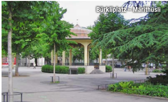
Bürkliplatz – Märthüsl