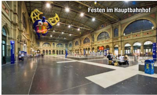
Festen im Hauptbahnhof