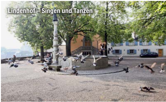
Lindenhof – Singen und Tanzen