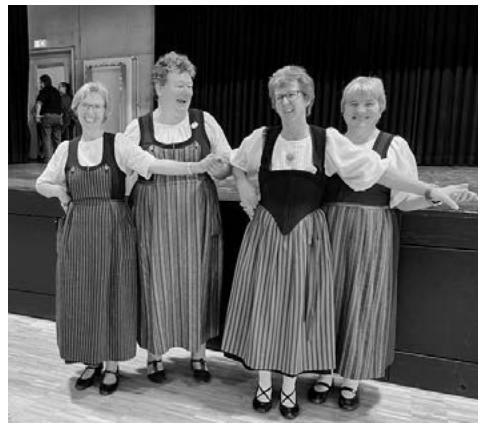
De Leiterinne e grosse Dank