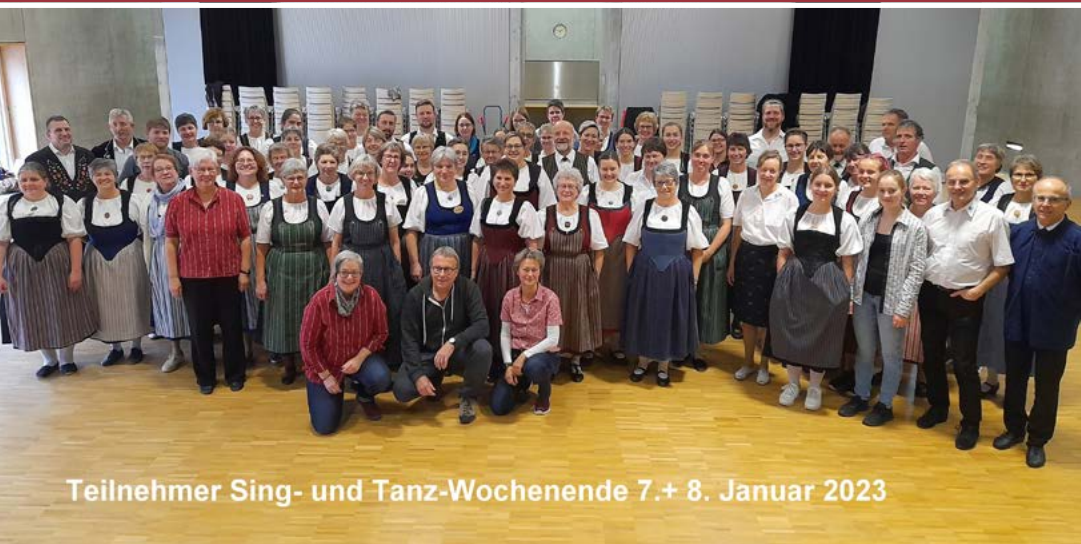
Teilnehmer Sing- und Tanz-Wochenende 7.+ 8. Januar 2023